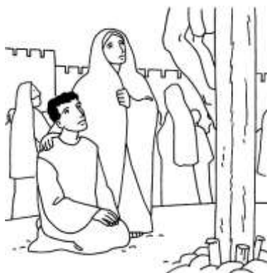
Au pied de la croix

Quand Jésus a 30 ans, il se fait baptiser par Jean Baptiste. Puis il est invité à un mariage à Cana ; sa mère est là et quelques-uns de ses amis. Il y a tellement de monde que le vin manque. Attentive, Marie s'en aperçoit et le signale à son fils. Elle veut tirer les mariés de l'embarras. Elle a confiance en Jésus et elle a raison. Elle dit aux serviteurs : « Faites tout ce qu'il vous dira ( Il= c'est Jésus) ». Et Jésus change l'eau en vin : à la demande de sa mère, Jésus accomplit son premier miracle. (Jn 2, 1-12)