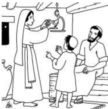
La vie à Nazareth

4 ème sens : le toucher (par les câlins des parents)