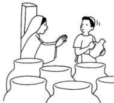
Les Noces de Cana

5 ème sens : le goût (par les fruits du pays de Jésus : dattes ; figues ; raisin ; amandes ; noix + pain pitta)