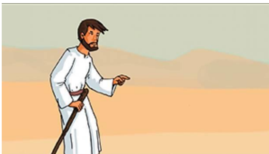
Jésus au désert