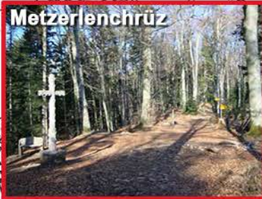
5 - Arrivée 9h15 env. ravitaillement