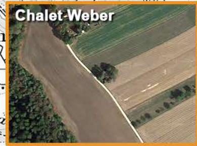
7 - Pique-nique tiré du sac à 14h env. boissons disponibles