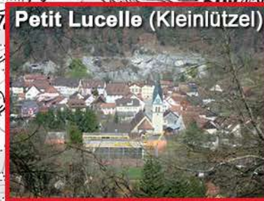
4 - Départ à 7h20