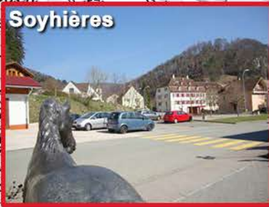
1 - Départ à 5h30 Parking du Cavalier