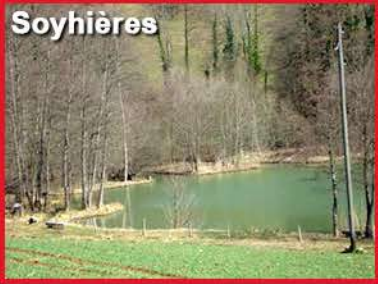
2 - Etang de la Réselle