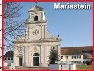
6 - Arrivée à 10h15 env. Liturgie à 11h Départ devant la basilique à 12h