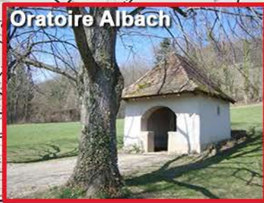
3 - Regroupement et recueillement