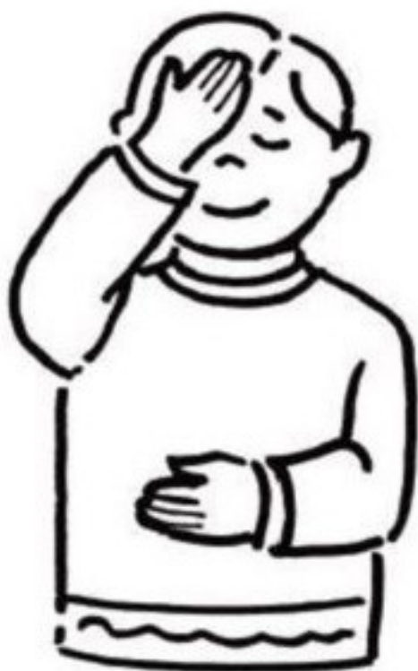
Au nom du Père