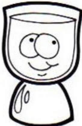
Dieu le Fils