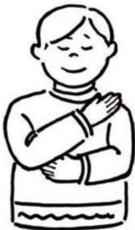
et du Saint Esprit