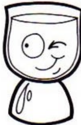
Dieu le Saint Esprit