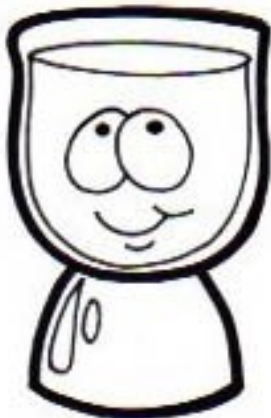
Dieu le Père