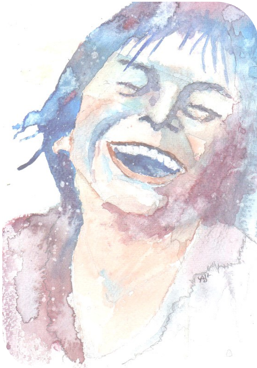
aquarelle yvan besnard

Aujourd'hui, Jésus, J'ai décidé de te ressembler.