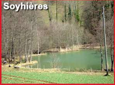
2 - Etang de la Réselle