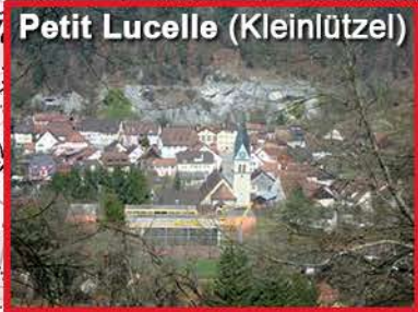
4 - Départ à 7h20