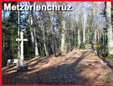
5 - Arrivée 9h15 env. ravitaillement