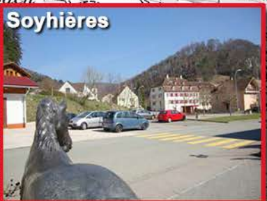
1 - Départ à 5h30 Parking du Cavalier