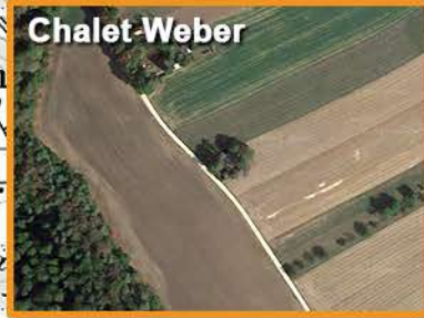
7 - Pique-nique tiré du sac à 14h env. boissons disponibles