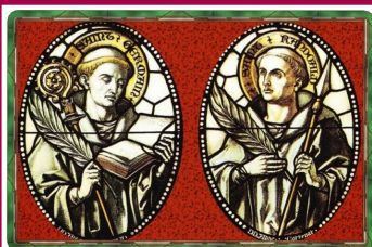
Saints Germain et Randoald